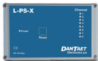
Kontrolboks type L-PS-X